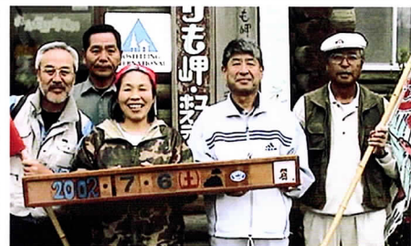
襟裳岬ユースホステルにて

ますが目に見える星やガスを全部集めても宇宙全体の4%にしかありません。残り23%は正