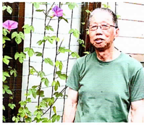
今年も(種のできない)朝顔が咲きました

2013年1月に(有)清野精機さんの一室を借りて福東OB会事務所を開所しました。事務所が出来たことにより定期的に集まる事が出来て活動の幅を広げることが出来たと思います。そして会員の皆さんへ出来るだけ早くOB会の状況、情報をお知らせす